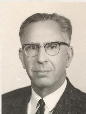
تصویر ۲. دکتر ذبیح الله قربان بنیانگذار دانشکده پزشکی شیراز