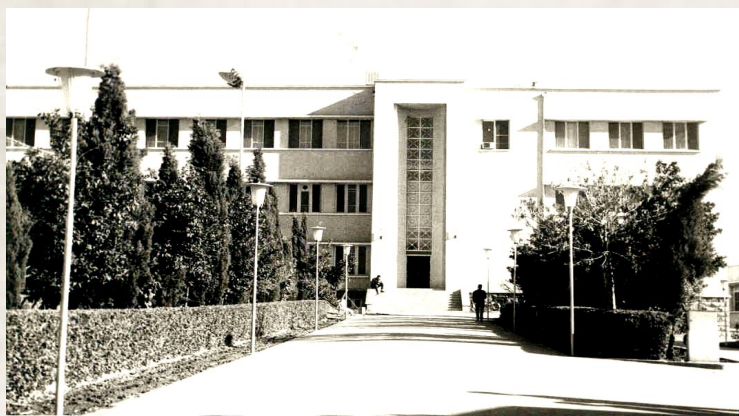
تصویر ۳. دانشکده پزشکی شیراز در دهه ۵۰