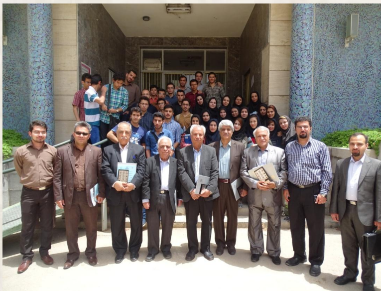
تصویر ۵. عکس یادمان تعدادی از اساتید پیشکسوت دانشکده با اساتید و دانشجویان جوان، پس از پایان سمینار