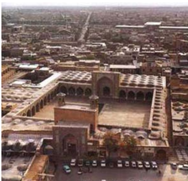
Vakil Mosque, Belongs to Zandieh dynasty (۱۷۹۴-۱۷۶۰ AD), Shiraz, Iran