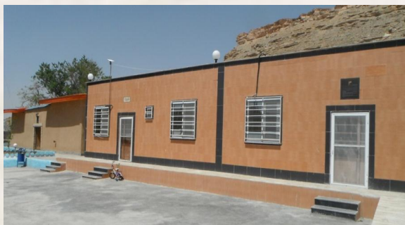
تصویر ۱۰. نمایی از پایگاه تحقیقاتی بیماری‌های نوپدید و بازپدید انستیتو پاستور ایران، اکنلو، کیودر آهنگ همدان.

از سال ۱۳۹۱ ه.ش. دور جدید فعالیت‌های پایگاه آغاز شد و با حمایت‌های مرکز مدیریت بیماری‌های واگیر وزارت بهداشت ساختمان‌های جدیدی ساخته شد و ساختمان‌های قدیمی بازسازی شدند. در سال ۱۳۹۳ ه.ش. این پایگاه تحقیقاتی موفق به کسب مرجعیت کشوری برای تشخیص بیماری‌های طاعون، تولاومی و تب کیو شد. این پایگاه همچنین مطالعاتی را در زمینه پایش سایر بیماری‌های نوپدید و بازپدید انجام می‌دهد (تصویر ۱۰). 70