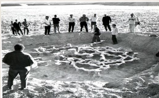
تصویر ۸. مشاهده لانه جوندگان مریوان با تزریق گچ به لانه. نشست سازمان بهداشت جهانی برای طاعون؛ استان همدان؛ روستای اکنلو سال ۱۳۴۱.