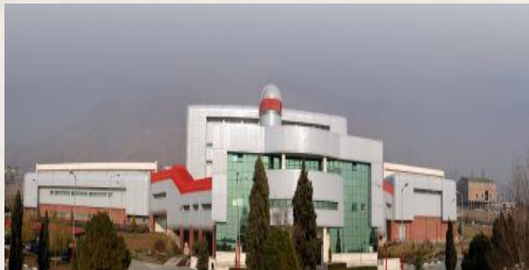
تصویر ۱۱. نمایی از مجتمع تولیدی تحقیقاتی انستیتو پاستور ایران، کیلومتر ۲۵ اتوبان تهران-کرج.