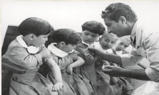
تصویر ۶. اجرای برنامه واکسیناسیون همگانی ب.ث.ژ براساس واکسن تولیدی انستیتو پاستور ایران از سال ۱۳۲۶ه.ش. در کشور.

انستیتو پاستور فرانسه در ایران، مقرر شد تا بخش تولید واکسن ب.ث.ژ در ایران ایجاد گردد. اولین سوش ب.ث.ژ در بهار سال ۱۳۲۶ه.ش. به ایران آورده شد و سپس واکسن ب.ث.ژ تهیه و تولید و اولین عملیات واکسیناسیون ب.ث.ژ ساخت ایران از سال ۱۳۲۶ه.ش. در تهران شروع گردید (تصویر ۶). 60