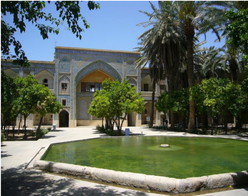
Khan School, a historical school built in Safavid era in Shiraz city