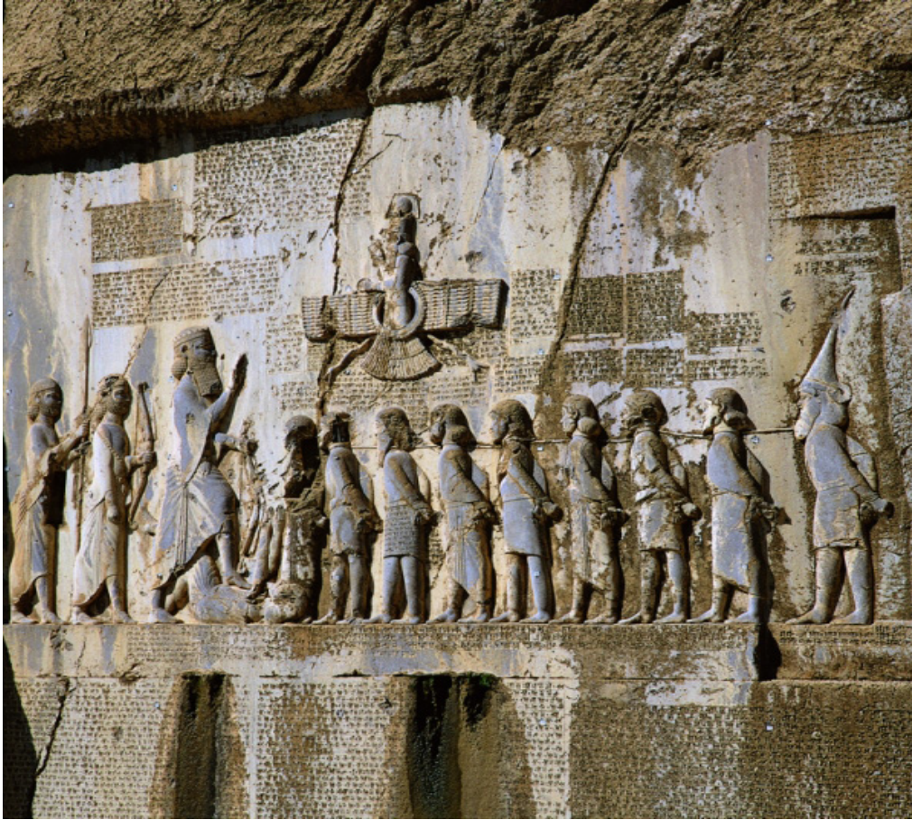
The Bistun Inscription is a multi-lingual inscription, Authored by Darius the Great, located on Mount Behistun in the Kermanshah Province of Iran, near the city of Kermanshah in western Iran.