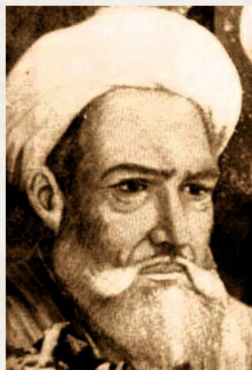
تصویر ۱. قطب الدین محمود بن مسعود کازرونی

قطب الدین پس از شروع تحصیل "قانون در طب" نزد پدر و عموی خود به حل مشکلات خود با استفاده از شروع قانون زیر نظر سایر اساتید وی در طب از جمله شمس الدین محمد کیشی، شرف الدین زکی بوشکانی پرداخته و سرانجام خویشتر را نیازمند مکتب خواجه نصیرالدین طوسی می یابد، به مراغه می رود و در محضر آن استاد مشکلات باقی مانده خود از کتاب قانون را حل می کند. پس از مراغه وی سفرهایی به خراسان، عراق عجم، بغداد و روم داشته و از حکما و اطبای آن دیار نیز بهره می جوید. وی سرانجام به مصر رسیده و پس از تسلط کامل بر کتاب "قانون در طب" بوعلی به شرح آن پرداخته و یکی از مهمترین شروح قانون را با نام "تحفه السعدیه" (تصویر ۲) تألیف می کند. 7